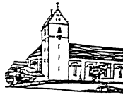
St. Odilia Hausen a.A.