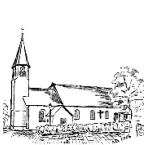
St. Anna Ablach