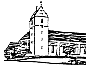
St. Odilia Hausen a.A.